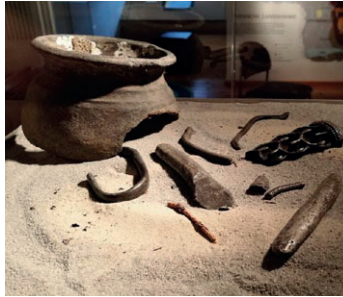
Wurde der Hort von Witzwort wirklich beim Pflügen gefunden?